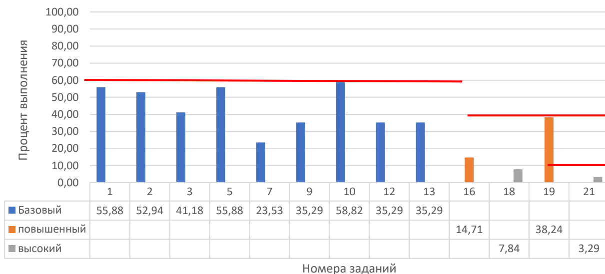
Рисунок 2. Задания, по которым участники не преодолели минимальный порог

Анализ результатов участников и типов заданий, попавших в перечень (табл. 2, рис. 2) выявил следующие частые затруднения участников экзамена: